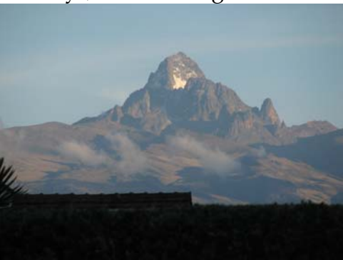
Mt. Kenya fra Mortens have

Der er flere årsager til farligheden. Som hvid er man pr. definition en pengekonto på to ben. Der er ikke noget lys, der virker på bilerne, folk er kulsorte og mange er i materiel forstand fattige. Og så er der vilde dyr, som skal tages seriøst.