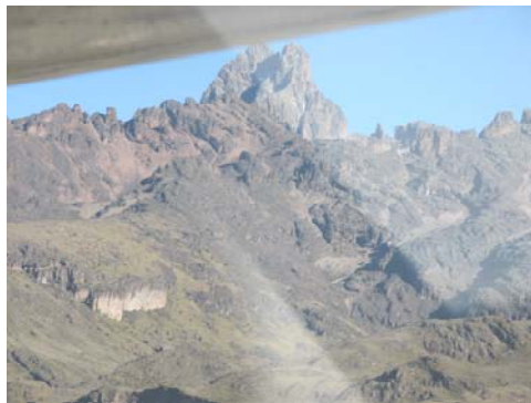
Mt. Kenya fra modsat side fra flyvetur i området Flyvehøjde: 3000 m.